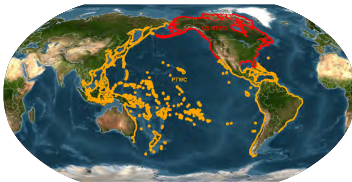
Áreas de cobertura de los dos centros de alerta de tsunamis de NOAA: Centro Nacional de Alerta de Tsunamis (rojo) y Centro de Alerta de Tsunamis del Pacífico (amarillo)

NWS administra dos centros de alerta de tsunamis, los cuales cuentan con personal las 24 horas del día, los 7 días de la semana. Los dos centros operan sistemas de monitoreo continuo para detectar terremotos y tsunamis, predecir el impacto de los tsunamis y, en los Estados Unidos, emitir mensajes nacionales de tsunamis (aviso, advertencia, vigilancia o boletín informativo) a los manejadores de emergencias y el público.